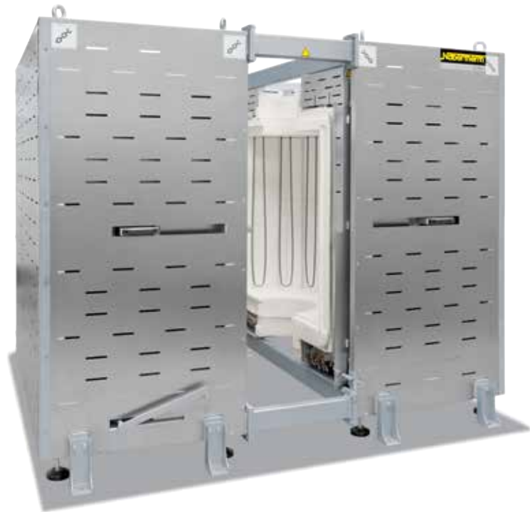
RS 460/1000/16S zur Integration in eine Produktionsanlage