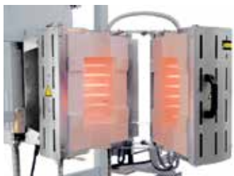
RS 100/250/11S in aufklappbarer Ausführung zum Einbau in eine Prüfvorrichtung

Durch einen hohen Grad an Flexibilität und Innovation bietet Nabertherm die optimale Lösung für kundenspezifische Anwendungen.