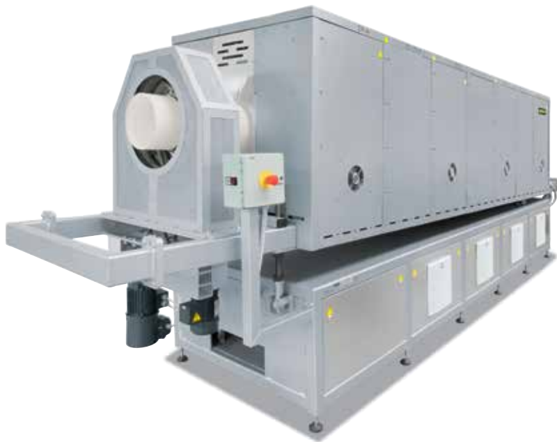
Drehrohrföfen RSR 250/3500/15S