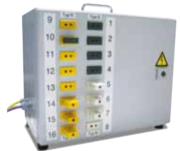
Módulo TUS con entrada para 16 termoelementos y conexión Profibus para el Nabertherm Control-Center

El módulo TUS contiene un PLC propio, que convierte los resultados de medición de los termoelementos de ensayo. Seguidamente, el Nabertherm Control Center del horno procederá a evaluar los datos, incl. una sencilla función de protocolización de los mismos.