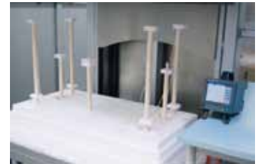
Estructura de medición en un horno de altas temperaturas