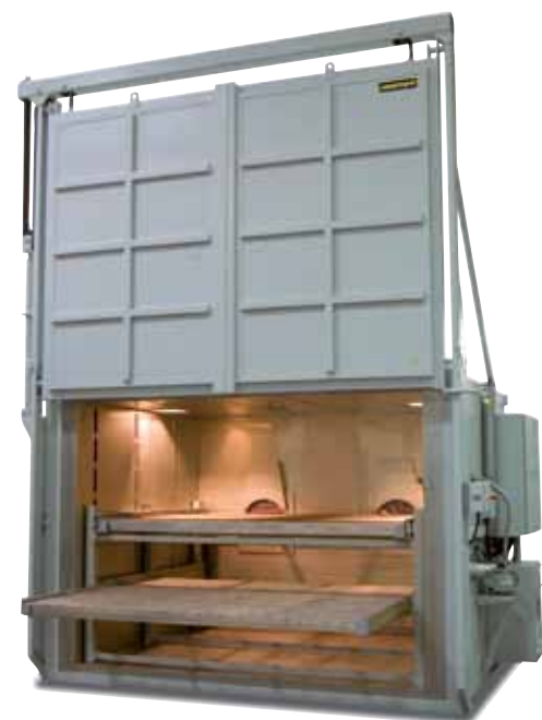
N 12012/26 HAS1 según la norma AMS 2750 D

Además de poder elegir entre una instrumentación mediante regulación PLC y Nabertherm Control-Center (NCC), alternativamente, también se pueden emplear reguladores y registradores de temperatura. El registrador de temperatura posee una función de protocolización que debe configurarse manualmente. Los datos se pueden almacenar en una memoria USB, leer, evaluar en un ordenador diferente, formatear e imprimir. Además del registrador de temperatura integrado en la instrumentación estándar, también se requiere un registrador individual para las mediciones TUS (véase página 68).