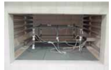
Estructura de medición en un horno de recocido