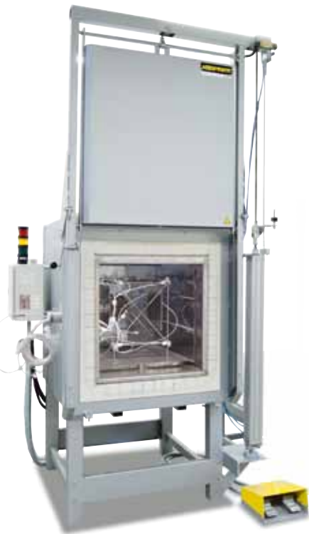
Estructura de medición para determinar la homogeneidad de la temperatura

La medición de la distribución de la temperatura se realiza a una temperatura teórica predeterminada por el cliente después de un tiempo de mantenimiento previamente definido. A demanda también se pueden calibrar diferentes temperaturas teóricas o un margen teórico de trabajo definido.