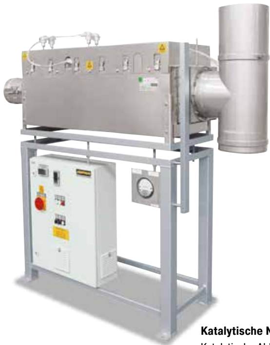
Ofenunabhängige katalytische Nachverbrennung zur Nachrüstung an bestehende Anlagen

Zur Abluftreinigung, insbesondere beim Entbindern, bietet Nabertherm auf den Prozess zugeschnittene Abgasreinigungssysteme an. Die Nachverbrennung wird fest an den Abgasstutzen des Ofens angeschlossen und entsprechend in die Regelung und in die Sicherheitsmatrix des Ofens eingebunden. Für bereits bestehende Ofenanlagen können auch ofenunabhängige Abgasreinigungssysteme angeboten werden, die separat geregelt und betrieben werden können.