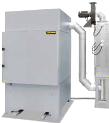
Umluft-Kammerofen NA 500/65 DB200 mit katalytischer Nachverbrennungsanlage