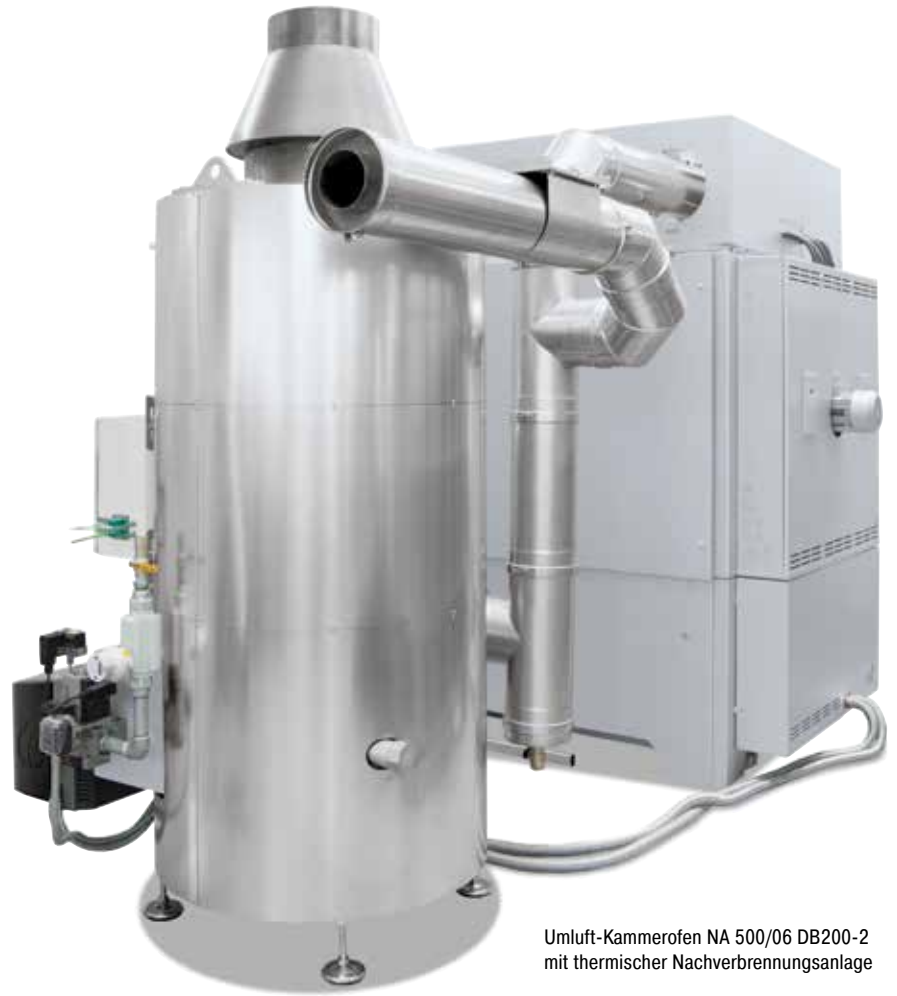
Umluft-Kammerofen NA 500/06 DB200-2 mit thermischer Nachverbrennungsanlage