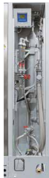
Abgaswäscher für die Reinigung ent-stehender Prozessgase durch Auswaschen

Ein Abgaswäscher kommt oftmals zum Einsatz, wenn Abgase entstehen, die mit einer Abgasfackel oder thermischen Nachverbrennung nicht erfolgreich nachbehandelt werden können. Die unerwünschten Bestandteile des Abgases werden innerhalb der Kontaktstrecke des Wäschers in einer Waschflüssigkeit abgeschieden. Durch Auswahl der Waschflüssigkeit sowie Auslegung von Flüssigkeitsaufgabe und Kontaktstrecke kann der Wäscher prozessspezifisch angepasst werden und so gasförmige, flüssige oder auch feste Bestandteile erfolgreich aus dem Abgas waschen.