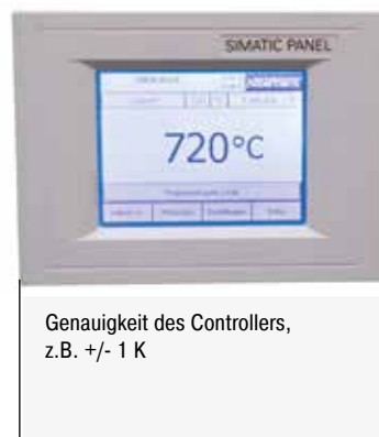
Genauigkeit des Controllers, z.B. +/- 1 K