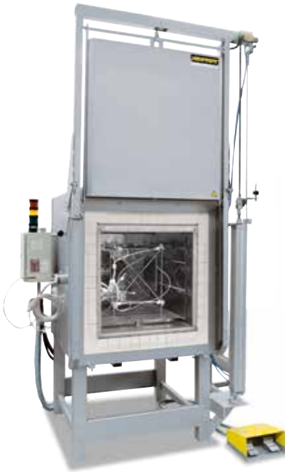
Messgestell zur Ermittlung der Temperaturgleichmäßigkeit

Beim Standardofen wird eine Temperaturgleichmäßigkeit in +/- K ohne Vermessung des Ofens garantiert. Als Zusatzausstattung kann jedoch eine Temperaturgleichmäßigkeitsmessung bei einer Soll-Temperatur im Nutzraum nach DIN 17052-1 bestellt werden. Je nach Ofenmodell wird ein Gestell in den Ofen eingebracht, welches den Abmessungen des Nutzraumes entspricht. An diesem Gestell werden an definierten Messpositionen (11 mit rechteckigem Querschnitt, 9 mit kreisförmigem Querschnitt) Thermoelemente befestigt. Die Messung der Temperaturverteilung erfolgt bei einer vom Kunden vorgegebenen Soll-Temperatur nach einer vorab definierten Haltezeit. Sofern gefordert, können auch unterschiedliche Soll-Temperaturen oder ein definierter Soll-Arbeitsbereich kalibriert werden.