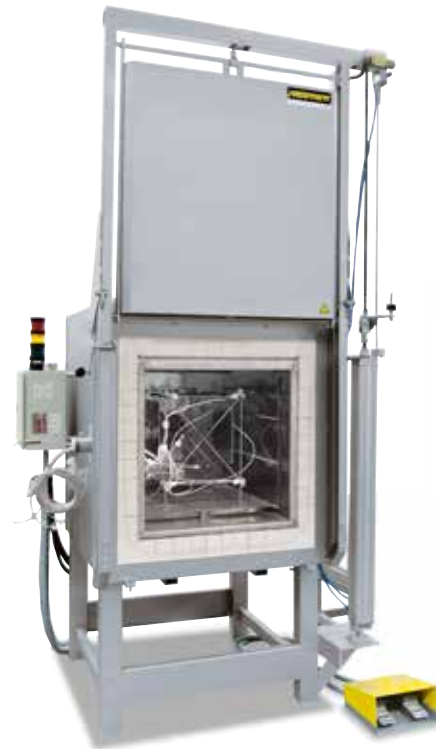
Messgestell zur Ermittlung der Temperaturgleichmäßigkeit

Beim Standardofen wird eine Temperaturgleichmäßigkeit in +/- K ohne Vermessung des Ofens garantiert. Als Zusatzausstattung kann jedoch eine Temperaturgleichmäßigkeitsmessung bei einer Soll-Temperatur im Nutzraum nach DIN 17052-1 bestellt werden. Je nach Ofenmodell wird ein Gestell in den Ofen eingebracht, welches den Abmessungen des Nutzraumes entspricht. An diesem Gestell werden an 11 definierten Messpositionen Thermoelemente befestigt. Die Messung der Temperaturverteilung erfolgt bei einer vom Kunden vorgegebenen Soll-Temperatur nach einer vorab definierten Haltezeit. Sofern gefordert, können auch unterschiedliche Soll-Temperaturen oder ein definierter Soll-Arbeitsbereich kalibriert werden.