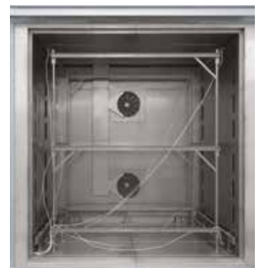
Steckbares Messgestell für Umluft-Kammerofen N 7920/45 HAS