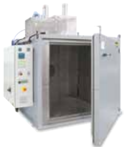
Kammertrockner KTR 2000 zum Aushärten von Bindern nach dem 3D-Druck