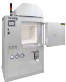
HT 160/17 DB200 für das Entbindern und Sintern von Keramiken nach dem 3D-Druck

Die additive Fertigung ermöglicht die direkte Umwandlung von Konstruktionsdateien in voll funktionsfähige Objekte. Über den 3D-Druck werden Objekte aus Metall, Kunststoff, Keramik, Glas, Sand oder anderen Materialien schichtweise aufgebaut, bis sie ihre fertige Gestalt erreicht haben.