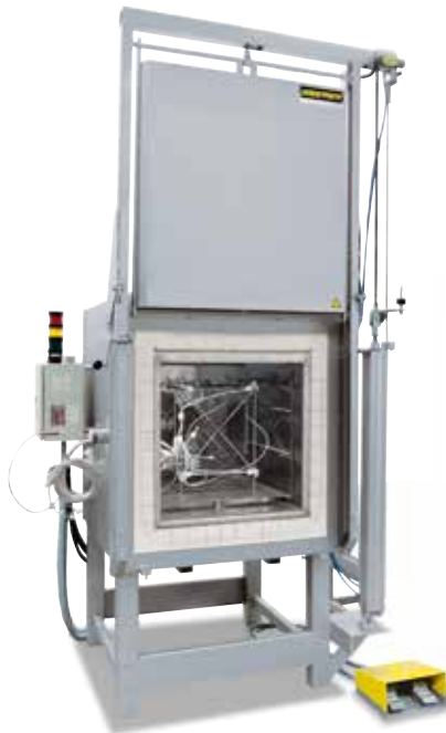
Messgestell zur Ermittlung der Temperaturgleichmäßigkeit

Beim Standardofen wird eine Temperaturgleichmäßigkeit in +/- K ohne Vermessung des Ofens garantiert. Als Zusatzausstattung kann jedoch eine Temperaturgleichmäßigkeitsmessung bei einer Soll-Temperatur im Nutzraum nach DIN 17052-1 bestellt werden. Je nach Ofenmodell wird ein Gestell in den Ofen eingebracht, welches den Abmessungen des Nutzraumes entspricht. An diesem Gestell werden an definierten Messpositionen (11 mit rechteckigem Querschnitt, 9 mit kreisförmigem Querschnitt) Thermoelemente befestigt. Die Messung der Temperaturverteilung erfolgt bei einer vom Kunden vorgegebenen Soll-Temperatur nach einer vorab definierten Haltezeit. Sofern gefordert, können auch unterschiedliche Soll-Temperaturen oder ein definierter Soll-Arbeitsbereich kalibriert werden.