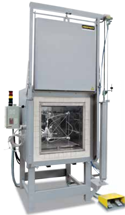
Messgestell zur Ermittlung der Temperaturgleichmäßigkeit

Beim Standardofen wird eine Temperaturgleichmäßigkeit in +/- K ohne Vermessung des Ofens garantiert. Als Zusatzausstattung kann jedoch eine Temperaturgleichmäßigkeitsmessung bei einer Soll-Temperatur im Nutzraum nach DIN 17052-1 bestellt werden. Je nach Ofenmodell wird ein Gestell in den Ofen eingebracht, welches den Abmessungen des Nutzraumes entspricht. An diesem Gestell werden an 11 definierten Messpositionen Thermoelemente befestigt. Die Messung der Temperaturverteilung erfolgt bei einer vom Kunden vorgegebenen Soll-Temperatur nach einer vorab definierten Haltezeit. Sofern gefordert, können auch unterschiedliche Soll-Temperaturen oder ein definierter Soll-Arbeitsbereich kalibriert werden.