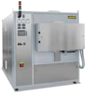
Retortenofen NR 150/11 zum Spannungsarmglühen von Metall-Bauteilen nach dem 3D-Druck

Die additive Fertigung ermöglicht die direkte Umwandlung von Konstruktionsdateien in voll funktionsfähige Objekte. Über den 3D-Druck werden Objekte aus Metall, Kunststoff, Keramik, Glas, Sand oder anderen Materialien schichtweise aufgebaut, bis sie ihre fertige Gestalt erreicht haben.