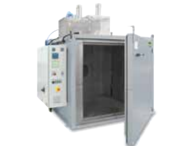
Kammertrockner KTR 2000 zum Aushärten von Bindern nach dem 3D-Druck