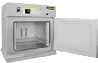
Trockenschrank TR 240 zum Trocknen von Pulvern

In den meisten Fällen müssen diese Objekte nach dem Druck wärmebehandelt werden. Nabertherm bietet Lösungen vom Aushärten der Binder zur Erhaltung der Grünfestigkeit bis hin zum Vakuumofen an, in denen die Objekte aus Metall spannungsarm gegläht bzw. gesintert werden.