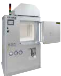
HT 160/17 DB200 für das Entbindern und Sintern von Keramiken nach dem 3D-Druck

Auch begleitende bzw. vorgelagerte Prozesse der additiven Fertigung erfordern den Einsatz eines Ofens, um die gewünschten Produkteigenschaften zu erzielen wie z.B. das Wärmebehandeln oder Trocknen der Pulver.