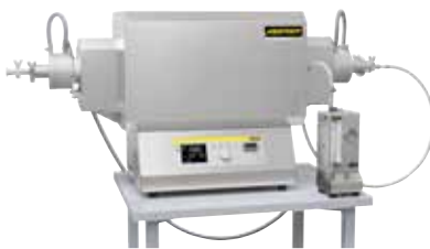
Kompakter Rohrofen zum Sintern oder Spannungsarmglühen nach dem 3D-Druck unter Schutzgas oder Vakuum