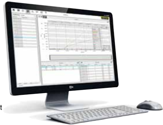
Logiciel VCD pour commande, visualisation et documentation

Le logiciel VCD sert à l'enregistrement des données de processus des programmeurs B400/B410, C440/C450 et P470/P480. Il permet de mémoriser jusqu'à 400 programmes de traitements thermiques. Les programmeurs sont mis en marche et à l'arrêt par le logiciel. Le process est enregistré et archivé en conséquence. Les données peuvent être visualisées sur diagramme ou sur tableau. Il est également possible de transmettre les données de processus à MS Excel (au format *.csv) ou de générer un rapport au format PDF.