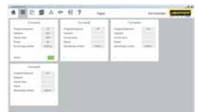
Représentation graphique de la vue d'ensemble (version à 4 fours)