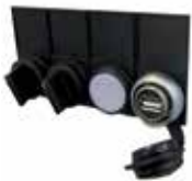
NTLog Comfort pour l'enregistrement des données d'un automate Siemens

Les enregistrements comportent des données de contrôle afin d'être protégés contre toute manipulation involontaire du fichier de données.