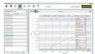
Représentation graphique de la courbe de combustion