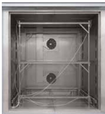
Cadre de cartographie adapté pour four à chambre à circulation d'air N 7920/45 HAS

On entend par homogénéité de température un écart maximal de température défini dans l'espace utile du four. On distingue, d'une manière générale, la chambre de four et l'espace utile. La chambre de four est le volume disponible en totalité dans le four. L'espace utile est plus petit que la chambre du four et décrit le volume pouvant être utilisé pour le chargement.